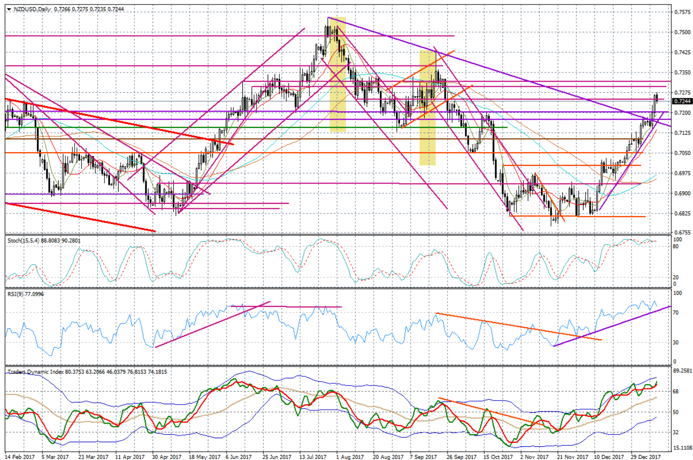
Wykres dzienny NZD/USD

Na wykresie EUR/USD widać kolejne podejście pod poziom ostatnich szczytów, chociaż złamanie rejonu 1,2092 jeszcze dzisiaj wcale nie jest tak oczywiste. Wspólna waluta została wczoraj wsparta przez „jastrzębie” zapiski z ostatniego posiedzenia ECB – rynek ponownie spekuluje, czy program QE zakończy się we wrześniu – a dzisiaj rano przez informacje nt. postępów w rozmowach koalicyjnych w Niemczech pomiędzy SPD, a chadekami Angeli Merkel.