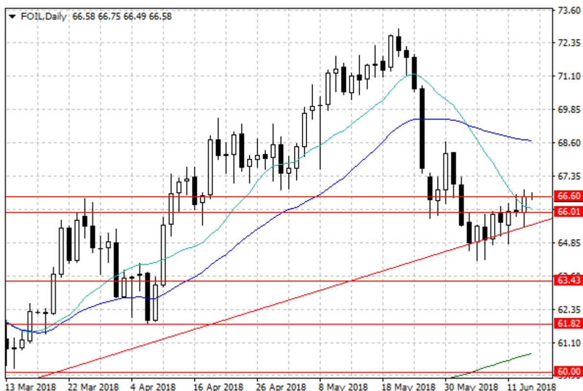
Notowania ropy naftowej WTI – dane dzienne

Wczoraj pozytywnie na ceny ropy naftowej WTI wpłynęły przede wszystkim dane zawarte w raporcie amerykańskiego Departamentu Energii. Instytucja ta podała, że w minionym tygodniu zapasy ropy naftowej w USA spadły o 4,1 mln baryłek, przy czym oczekiwano niższej o niecałe 3 mln baryłek. Zaskoczeniem był spadek zapasów benzyny i destylatów (odpowiednio o 2,3 mln i 2,1 mln baryłek), podczas gdy oczekiwano, że ich poziom nie zmieni się znacząco.